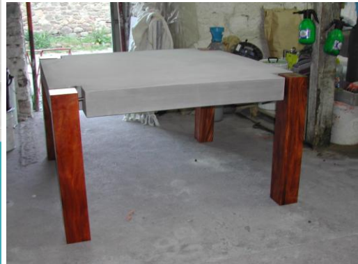
Blocs de béton d'Ecographite associé a un parement